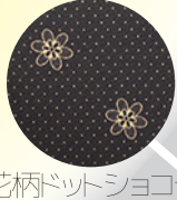
花柄ドットショコラ