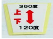
L-9: 前輪キャスターシール (1枚)