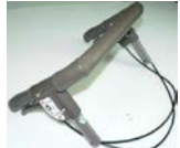
L-55: 押し手本体SET (52: エンドかぶせ2個付)