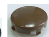
L-41: 車輪キャップ (1個)