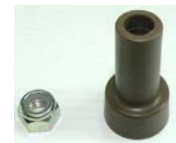
L-73: 後輪軸通しカバー (片側1個SET)