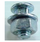
50: ワイヤー止めナットSET