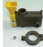
L-46: 前輪キャスターSET (車輪無)