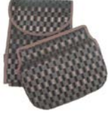
L-6: バック部本体 (2色有り)(底板付)(1SET)