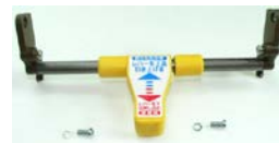
L-37: 固定用ロックレバーパイプ一体型 (1SET)