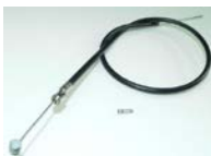
L-49: ブレーキワイヤー (1本) (52: エンドかぶせ1個付)