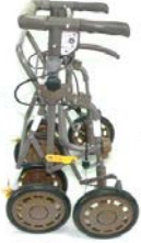
L-1: フレーム (1台)