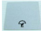
10: 反射シール (1枚)