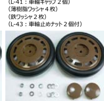
L-40: 後車輪SET (車輪2枚SET) (L-41: 車輪キャップ2個) (薄樹脂ワッシャ4枚) (鉄ワッシャ2枚) (L-43: 車輪止めナット2個付)