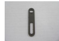
30 前輪キャスト 回転止めプレート(1コ)