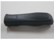
28 押し手グリップ (1コ)