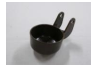
29 かさ止めブラケット (1コ)