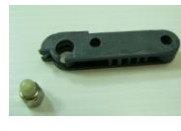
44 ブレーキ作動板 (1コ)