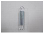
17 座面折りたたみパネ (1コ)