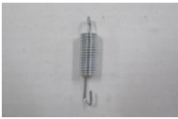
16 本体折りたたみパネ (1コ)