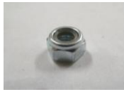
38 車輪止めナット (1コ)