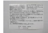
10 本体表示シール (1枚)