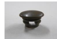
25 パイプエンドツム 6分パイプ用(1コ)