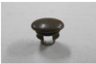
26 パイプエンドツム 5分パイプ用(1コ)