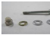
22 かさ止めブラケット ネジSET