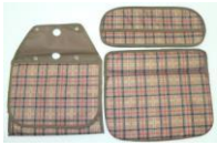
6 バッグ部本体 (底板付)(1SET)