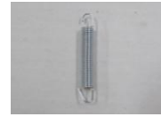
14 後輪ブレーキパネ (1コ)