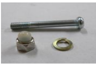
21 ワイヤ流れ止め 上部ネジ(肘掛けネジ)