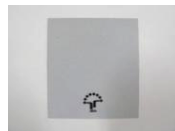
8 反射シール (1枚)