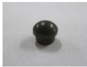
27 パイプエンドツム 4分パイプ用(1コ)