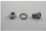
46 ワイヤ止めナット SET