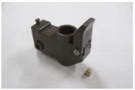
41 前輪キャストSET (車輪無)