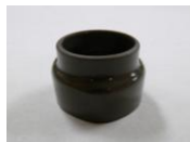
23 押し手高さ調節 キャップ(1コ)