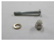
18 ブレーキ本体ネジ SET