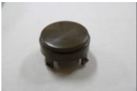
36 車輪キャップ (1コ)