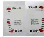
9 ブレーキシール (2枚SET)