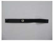
12 かさ止めバンド (ボタン式)(1コ)