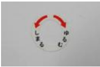
11 ブレーキ調整シール (1枚)