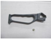
42 ブレーキレバー SET