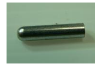
45 ブレーキ作動板 連結ピン(1コ)