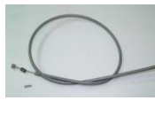
43 ブレーキワイヤー (1本)