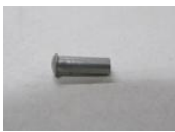
48 ブレーキワイヤー かぶせ(1コ)