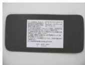
7 底板 (1枚)