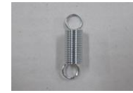
15 前輪キャストパネ (1コ)