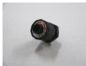
47 ワイヤ調整ネジ SET