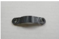
31 ワイヤ流れ止め (1コ)