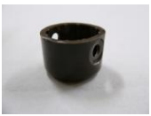
37 前輪キャスト 受け(1コ)