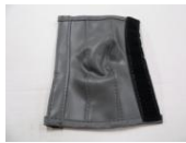
32 ひじかけカバー (1コ)