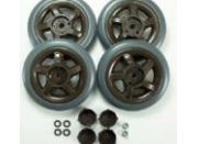
34 前車輪SET (車輪4枚SET)