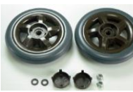
35 後車輪SET (車輪2枚SET)