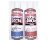
13 スプレー塗料 300ml(1缶)