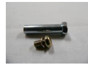
19 ブレーキレバー部 ネジSET