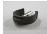
24 押し手高さ調節ピン (1コ)