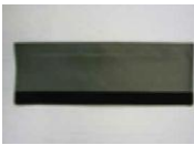
33 押し手カバー (1コ)